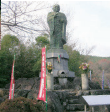
神野寺是空海修建的特殊17号寺院，有空海的铜像。