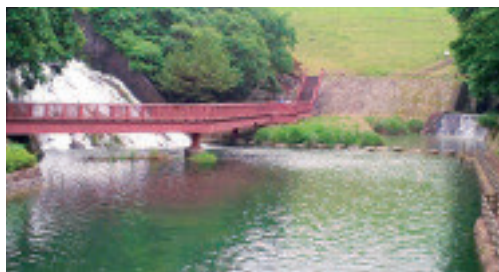
只有满浓池水满后，从溢洪道向金仓川流出时才会出现的梦幻瀑布

满浓池是人工修建的蓄水的水库。属于日本最大规模，池塘状如伸开的手掌，蓄水量为1540万立方米，相当于6160个奥运会游泳池。周长约20公里，水深约22米，灌溉面积约3000公顷。距今1200年前，由弘法大师空海设计，至今仍使用的结构中，有分散水的压力的弧形堤坝，以及将多余的水排放到下游，使水位保持固定的溢洪道。