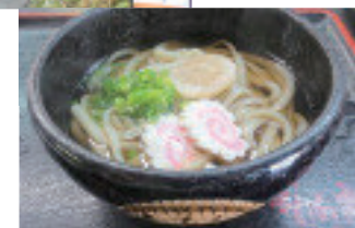
花梨亭的手制乌冬面