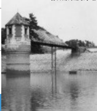
昔日的砖砌取水塔