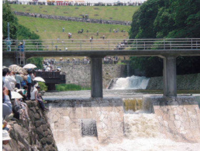
开闸放水的热闹场面