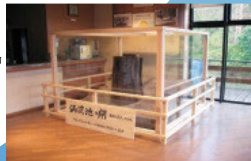
在花梨会馆展出的“YURU”

这是过去的“YURU”的设计图，呈自上而下依次拔掉的结构。因为冰凉的水对水稻无益。